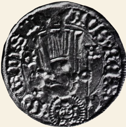
Minca z archeologického náleziska Krigov